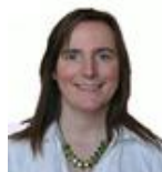
Interview par Fanny COLS